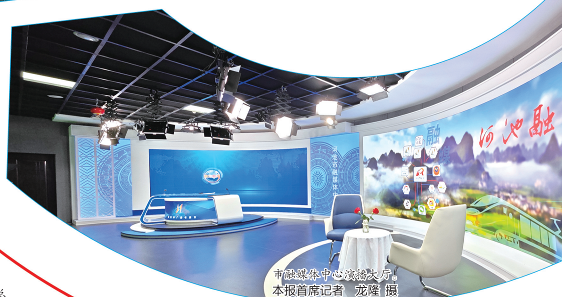
融媒体中心演播大厅。