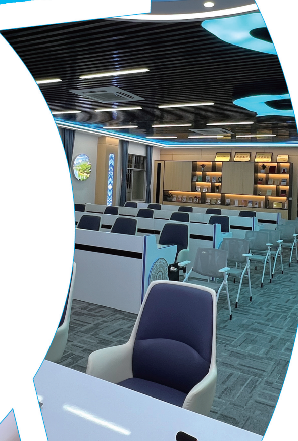
融媒体中心指挥调度中心。