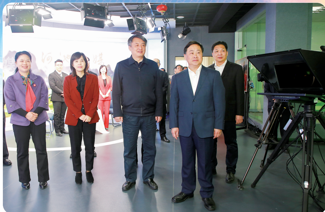
参加揭牌仪式的领导参观融媒体中心指挥调度中心。