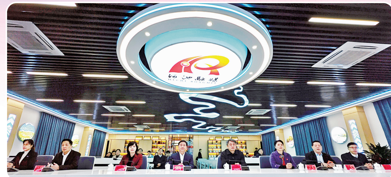
参加揭牌仪式的领导参观融媒体中心指挥调度中心。

1984年10月1日,河池市委机关报《河池日报》创刊;1995年8月28日,河池市广播电视台的前身河池地区金城江电视台正式开播。扎根河池大地的两家党媒,记录时代风云,适应技术变迁,与时俱进谋发展,从“铅与火”“光与电”的传统媒体发展时代,共同步入“数与网”“云与端”的全媒体融合发展时代。