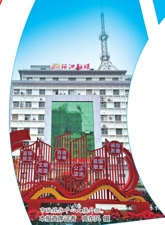
融媒体中心大楼外景。本报首席记者 高东风 摄